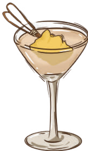
Terry Käse 奶酪酒 ☆

(Käse, Zitronensaft, Wodka, Milch, schwarzer Pfeffer, Wein)