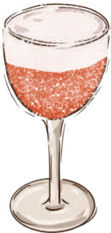
Erdbeer Kokos Genuss 草莓椰子糖

(Erdbeeren, Erdbeer-Gin, Kokoswasser, Pfirsichlikör, Zitronensaft, Kokosmilch)