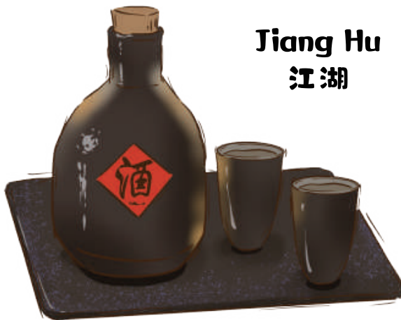
Jiang Hu 江湖

(Reiswein, Chinesischer Schnaps, schwarzer Johannisbeerlikör, Zitronensaft, Sirup)