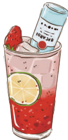
Erdbeer Mojito 草莓莫吉托

(Erdbeeren, Rum, Sirup, Mineralwasser, Minze, Zitrone)